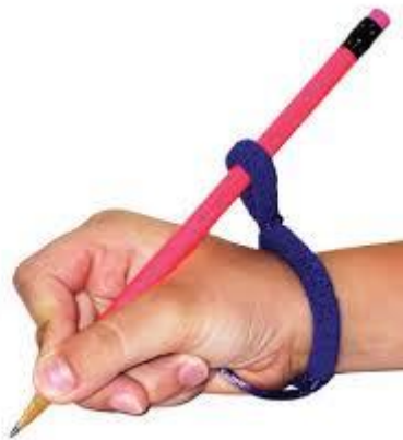
een trucje om het potlood te laten liggen

Groep 3: hier leren de kinderen de juiste lettersporen. Belangrijk is dat de lettersporen op de juiste manier aangeleerd en ingeslepen worden. Thuis kunt u hier een grote rol in betekenen. U kunt elke dag na het eten samen de geleerde letter met de vinger op de tafel schrijven, 10x met de ogen open en 10x met de ogen dicht. De leerkrachten kunnen de juiste lettersporen meegeven. Verder wordt in groep 3 de juiste pengreep verder ontwikkeld. Het is belangrijk dat het potlood blijft liggen en de sturing van het potlood uit de vingers komen. Als dit niet goed lukt, weten de leerkrachten een aantal trucjes om dit te verbeteren.