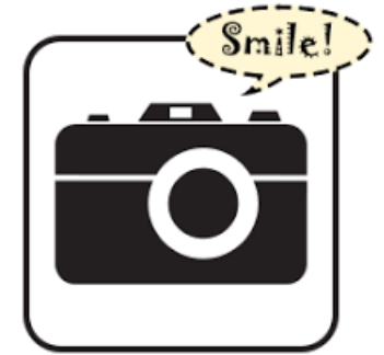
Foto en filmgebruik op school

Er worden regelmatig foto's gemaakt van schoolactiviteiten. Wanneer u uw kind aanmeldt op de school kunt via het inschrijfformulier aangeven of er foto's van uw kind gebruikt mogen worden voor communicatiemiddelen. U kunt in Social Schools (oudercommunicatieplatform) ten alle tijde uw besluit herzien of aanpassen. Bij de foto's worden nooit de adressen en telefoonnummers geplaatst.